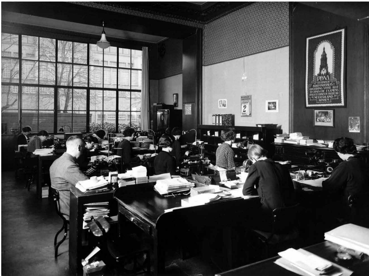
Een lokaal uit de tijd dat PBNA nog geen examen- maar een opleidingsinstelling was

verstrijken van de geldigheidstermijnen zal een herhalingsfeit optreden. Dat gaat vanaf 2014 of 2015 merkbaar worden. Tot die tijd verwacht Hiddink nog een jaarlijkse afname met tien tot vijftien procent.